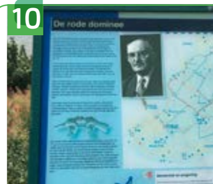
DE RODE DOMINEE SCHUIN T.O. LEKDIJK 162

Op de hoek met de Lekdijk ligt aan Grote Kerkstraat 2 dit dorpscafé, dat vermoedelijk al uit de 15e of 16e eeuw stamt. Op het gebouw met witgepleisterde muren staat het jaartal 1750. Menige eigenaar en uitbater heeft hier voor veel gezelligheid gezorgd. Aan de ligging is te zien dat het tegen de dijk aangebouwd is. Aan de kant van de Lekdijk is goed te zien dat de dijk in de loop der jaren opgehoogd is.