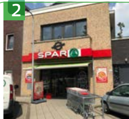
SPAR AMMERSTOL ACHTERWEG 36

In de Achterweg is SPAR Ammerstol, de enige supermarkt in de buurt. Het team werkt samen met mensen met een verstandelijke beperking of afstand tot de arbeidsmarkt. De supermarkt is samen met de naastgelegen snackbar gevestigd in een nieuwbouwcomplex van Beter Wonen. Sinds 2011 kan men na een winkelloos tijdperk van zeven jaar voor dagelijkse boodschappen weer terecht in het dorp. Voorheen stond hier de Openbare Lagere School van Ammerstol. De eerste school werd al in 1644 geopend. Bekende schoolmeesters waren J. van Munnickhoff in de 17e eeuw en A. van Noordwijk in de 19e eeuw. Deze meester werkte ook op de zalmafslag. Hij had van 1840 tot 1890 de leiding over deze school. Een ingemetselde steen bij de SPAR herinnert nog aan de inzamelingsactie voor diens gouden jubileum.