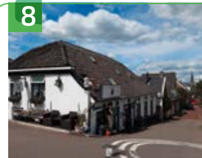
DORPSCAFÉ DE STAPPERS GROTE KERKSTRAAT 2

Aan Lekdijk 128-130 was voorheen het postkantoor dat in 1901 is gebouwd. In de architectuur komen veel kenmerken uit de Jugendstil en neorenaissance terug, zoals de aanzetstenen van de dakkapellen, tegelmozaïeken, speklagen van groene bakstenen en de getrapte puntgevel. Ook de kruispannen zijn typisch voor die periode. Het postkantoor werd al gauw hét centrum van de Ammerse zalmhandel. Destijds werkten maar liefst zes mensen om alle post en telefoonverkeer te behandelen. Ook was er in dit pand een bank gevestigd, zodat betalingen direct verwerkt konden worden.