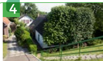
BOERDERIJ LEKDIJK 80

In de Achterweg is SPAR Ammerstol, de enige supermarkt in de buurt. Het team werkt samen met mensen met een verstandelijke beperking of afstand tot de arbeidsmarkt. De supermarkt is samen met de naastgelegen snackbar gevestigd in een nieuwbouwcomplex van Beter Wonen. Sinds 2011 kan men na een winkelloos tijdperk van zeven jaar voor dagelijkse boodschappen weer terecht in het dorp. Voorheen stond hier de Openbare Lagere School van Ammerstol. De eerste school werd al in 1644 geopend. Bekende schoolmeesters waren J. van Munnickhoff in de 17e eeuw en A. van Noordwijk in de 19e eeuw. Deze meester werkte ook op de zalmafslag. Hij had van 1840 tot 1890 de leiding over deze school. Een ingemetselde steen bij de SPAR herinnert nog aan de inzamelingsactie voor diens gouden jubileum.