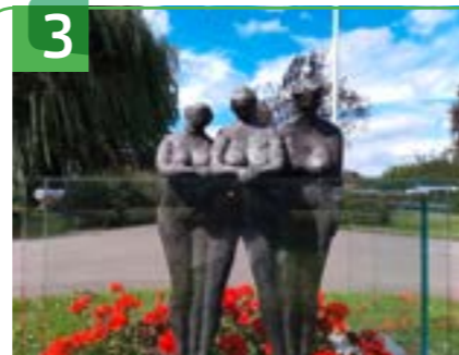
OORLOGSMONUMENT T.H.V. ACHTERWEG 2

De moerassige veengebieden, waaruit de Krimpenerwaard bestaat, zijn ontgonnen vanaf de 11e eeuw. Vanaf die tijd ontstonden er boerderijen op de koppen van de percelen. Het land van de boer lag vaak verspreid, maar het er rond de boerderij was bestemd voor de belangrijkste bebouwing en het werk van de boerin. De boerin verwerkte onder meer melk tot kaas. Bij deze boerderij zijn nog een melkkelder, kaaskamer en vrijstaande stal zichtbaar. De bomen voor het huis horen bij de boerderij. In de zomer zorgen ze voor schaduw en ze houden het huis, en dus ook de kaaskamer, koel.