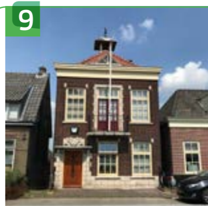
VOORMALIG RAADHUIS LEKDIJK 162

Op Lekdijk 75 staat het verenigingsgebouw van Ammerstol, kortweg 't Gebouw. Het is in 1927 gerealiseerd en het biedt doordeweeks onderdak aan diverse verenigingen, zoals de biljart-, dart-, toneel- en muziekvereniging. Van donderdag t/m zondag is het een eetcafé met zaalverhuur voor zakelijke en feestelijke gelegenheden. Van oktober tot juni treedt iedere twee weken op zondagmiddag een liveband op. Cultureel Café Ammerstol organiseert deze optredens al heel lang. Het is er altijd gezellig druk.