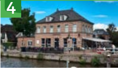
HOTEL OVER DE BRUG VEERLAAN 1

Al in 1467 werd hier, op verzoek van Karel de Stoute, een brug aangelegd en tol geheven. Dat zinde Gouda niet en aangezien Gouda veel machtiger was dan Haastrecht werd de brug ongeveer vijf jaar later verplaatst naar wat nu Stolwijkersluis heet. Ook die brug is later weer verplaatst, maar heet nog steeds de Haastrechtse Brug. De oeververbinding bij Haastrecht werd weer een voetveer. Pas in 1883 kwam hier deze brug, vanwege de aanleg van een tramlijn tussen Gouda en Oudewater.