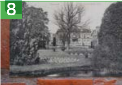
KOETSHUIS EN MUSEUM PAULINA BISDOM VAN VLIET HOOGSTRAAT 164-166