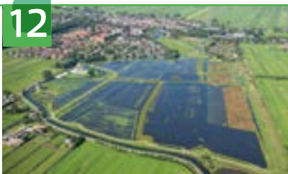
'T DOOVE GAT OF HOOGHE BOEZEM ACHTER HAASTRECHT

Het Doove Gat is een betrekkelijk nieuw natuurgebied bij Haastrecht, ook wel de Hooge Boezem achter Haastrecht genoemd. Het Zuid-Hollands Landschap heeft enkele jaren geleden het gebied opnieuw ingericht. Stukken weiland zijn afgegraven waardoor het areaal natte natuur enorm toenam. Plassen en weilanden wisselen elkaar af en in de plassen zijn eilandjes. De Hooge Boezem dient tevens als opvanggebied voor overtollig water. Het is een plasdrasegebied waar veel weide- en watervogels zich thuis voelen, zoals de Kievit en wulp. Ook riet- en zangvogels zijn er te vinden, zoals de blauwborst en kneu.