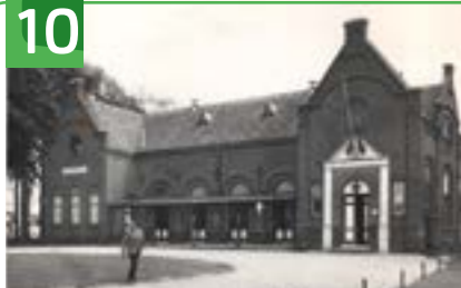
CULTUREEL CENTRUM CONCORDIA CONCORDIAPLEIN 1