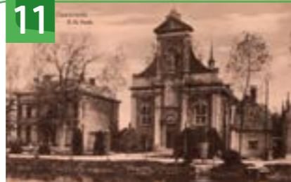
ROOMS-KATHOLIEKE KERK ST. BARNABAS EN MARIA KAPEL GROTE HAVEN 8