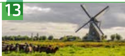
BOEZEMMOLEN NR.6 OOST VLISTERDIJK 1

Boezemmolen nr.6 is een ronde stenen molen met een uitgesproken klokvorm. Met een vlucht van meer dan dertig meter heeft deze windmolen de grootste vlucht van Nederland. De molen is de zesde in een serie van zeven boezemmolens die de boezem van het westelijk deel van de Lopiker- en het oostelijk deel van de Krimpenwaard bemaalden. Het water werd door deze molens van de Vlist naar de Hooge Boezem uitgeslagen. De boezemmolens, oorspronkelijk alle wipmolens, zijn in de loop der jaren vanaf 1486 gebouwd. Boezemmolen nr.6 is de derde molen op deze plaats en verving een houten achtkantige molen uit 1739. De molen is eigendom van Stichting Het Zuid-Hollands Landschap en in de periode 2010-2017 volledig gerestaureerd. In overleg met Hoogheemraadschap De Stichtse Rijnlanden maalt de molen sinds 2020 weer water in een deel van de oorspronkelijke Hooge Boezem. De molen is in principe elke zaterdag geopend voor bezoekers.