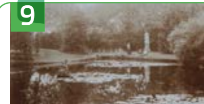
OVERTUIN BISDOM VAN VLIET T.O. HOOGSTRAAT 166

Voor 1618 had Haastrecht geen stadhuis en vergaderde het stadsbestuur in een herberg. Wetsovertreders werden in Schoonhoven gevangen gezet. Aanleiding dus om een stadhuis te bouwen. Het gebouw met ijsselsteentjes in Hollandse renaissancestijl kreeg aan de voorzijde een trapgevel met bordes en trap, een puntgevel aan de achterzijde en een rank klokkentorentje op het dak. Het gebouw heeft twee cellen. In gemeentelijke dienst waren één of twee burgemeesters, een secretaris, bode, dienaar der justitie, klapman of nachtwaker, asman, lantaarnopsteker en vroedvrouw.