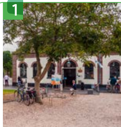
GEMAAL DE HOOG BOEZEM HOOGSTRAAT 31