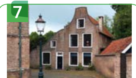
FRANSE SCHOOL OF HET OUDE SCHOOLHUIS KERKPLEIN 10

In de 13e eeuw had Haastrecht al een kerk. Het onderste deel van de toren dateert waarschijnlijk uit die tijd. Eind 14e eeuw is het schip van de kerk naar het westen verlengd zodat de toren voor een groot deel werd ingesloten. Rond 1575 is de kerk tijdens oorlogsgeweld verwoest. Begin 17e eeuw is de kerk herbouwd, maar zonder koor. De omtrek van het verdwenen koor is met lage muurtjes aan de oostzijde aangegeven. Eind 18e eeuw werd de torenbekroning vernieuwd. De kerk brandde uit in 1896 en in 1964 en beide keren is de kerk herbouwd. In de kerk is een grafkelder van de familie Bisdom van Vliet. Die kelder is het laatst geïnspecteerd en hersteld na de brand van 1896. Naast de kerk staat het fraai gedecoreerde brandweer- of spuihuisje. Na gebruik werden de slangen te drogen gehangen in de kerktoren.