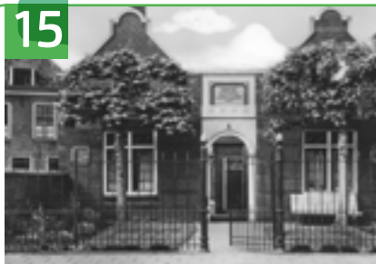
HOFJE VAN ZIJLL VAN DER HAM HOOGSTRAAT 52

Verzoek: respecteer de rust en privacy van de bewoners.