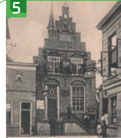
STADHUIS/RAADHUIS HOOGSTRAAT 79