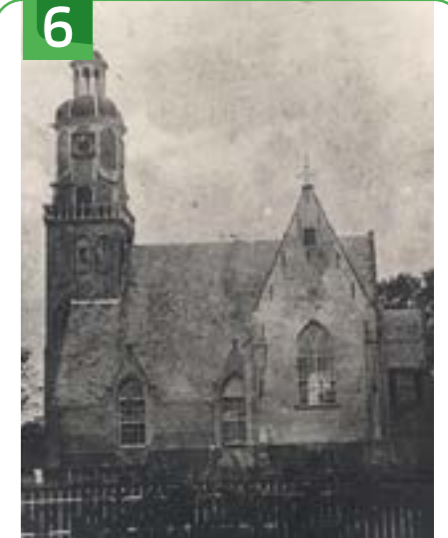
NEDERLANDS HERVORMDE KERK KERKPLEIN 9

Deze vrij toegankelijke Overtuin is eind 17e eeuw door Adriaan Bisdom aangelegd. Destijds pronkte men met tuinen volgens de laatste mode. Daarbij speelden tuinornamenten, zoals beelden en prieeltjes, maar ook een nagebouwde grot een grote rol. Begin 20e eeuw stond er een 'lighal' voor tbc-patiënten. In de 17e eeuw waren hier ook enkele touwbanen waar touw gesponnen werd dat onder meer werd gebruikt bij de scheepsbouw. De westelijk gelegen notenlaan diende als touwbaan. Enkele jaren geleden is een werkgroep Overtuin opgericht om dit park weer in haar oude luister te herstellen voor het honderdste sterfjaar (1923) van Paulina Bisdom van Vliet. De laatste bewoners van het huis liggen hier begraven. Ook hun hond heeft er een grafsteen.