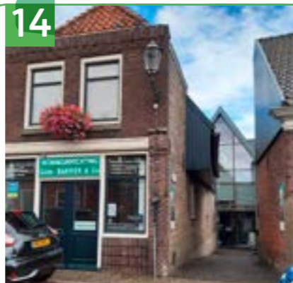
GEBR. BAKKER HOOGSTRAAT 32

Op deze hoogte aan de Hoogstraat zaten vroeger ook een slager, groenteboer, postkantoor, kruidenier en politiebureau. Er zaten langs de Hoogstraat zo'n zestig bedrijfsjes. Vrijwel iedereen vond werk op het dorp en het land eromheen. De Gebroeders Bakker waren een van de grootste werkgevers. De zaak bestaat inmiddels 150 jaar. Er werden houten kuipen gemaakt die later werden voorzien van elektrische roerwerken; de eerste elektrische wasmachines. Ter hoogte van hun huidige pand stond lange tijd een oude schuur met de gemeentelijke galg. Als de galg nodig was dan trok waarschijnlijk een paard met wagen deze door de Hoogstraat naar het stadhuis waar het vonnis voltrokken werd.