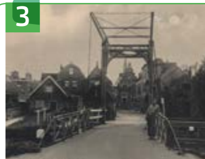
BRUG OVER IJSEL VEERSTRAAT

van de Lek naar de IJssel, vanwege tolheffing. Dordrecht voorzag schade aan haar economische belang en vernielde daarom de sluis in 1444. Er mocht toen alleen een schutsluis komen met een spil in het midden, waardoor uitsluitend schouwen konden passeren. Op deze overlaatplaats moest alles overgeladen worden van de ene naar de andere kant van de sluis. Daarvoor werd een rail aangelegd waarop karretjes liepen. Het bestratingpatroon toont met blauwe stenen de ligging van de rail. Het was een druk punt met veel bedrijvigheid en spelende kinderen. Aan de Hoogstraat versperden de patriotten Wilhelmina van Pruisen de weg. Haar aanhouding was op 18 juni 1787 in de Vlist. Zij wilde doorkomen naar Den Haag, maar is meegenomen naar Hekendorp en later teruggekeerd naar Schoonhoven.